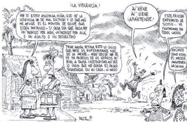
Caricatura tomada de El Diario de Hoy .

“Pocos se atreven a salir de sus casas en las noches en la colonia La Pradera. Ahí, se exponen a quedar en medio de un enfrentamiento entre pandilleros, o ser agredidos por delincuentes. No es un problema nuevo pero cada día se agudiza que los pobladores sientan que se trabaja por mejorar las cosas. El dominio de territorios por parte de traficantes de drogas, reclutamiento de personas para incorporarlas a las maras, los asaltos y agresiones, son problemas diarios. La Pradera es un sector rodeado por colonias que dominan miembros de diferentes pandillas. Sus calles son territorios en pugna por todas ellas. Hace varios meses hubo una división entre las maras Salvatrucha y Mirada Loca. Los integrantes de ambas merodeaban por el sector en busca de provocar riñas que les permitan cimentar su presencia. Aún está fresco en la memoria de los vecinos, el crimen ocurrido en agosto cuando grupos de antisociales se enfrentaron a balazos. Un niño de 13 años que no tenía nada que ver recibió un impacto y pereció en el sitio. En el año han resultado no menos de seis personas heridas de bala en diferentes ataques. Además la cifra de personas asaltadas o golpeadas por mareros es considerable. El miedo de las víctimas es el mayor aliado de los delincuentes.” (EDH 18 de noviembre)