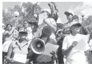
“Pandilleros y enmascarados”. EDH 10/11/05.

En EDH , una serie de acciones que se le adjudican a las pandillas fueron atribuidas en su momento a la guerrilla. En esta forma, encontramos un desplazamiento de las acciones que tenían el rostro de un fantasma anterior hacia uno nuevo. Las acciones permanecen ahí, son las mismas y esto permite descubrir algo que posteriormente ha sido utilizado como bandera política del partido ARENA: los guerrilleros, el partido político FMLN y los pandilleros son la misma cosa. En algunos casos, es el mismo periodista quien enlaza los hechos: quema de buses, profanar templos, rostros cubiertos, Mano Blanca.