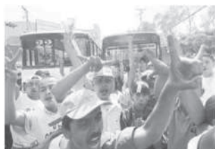
“Enardecidos integrantes de la Mara Salvatrucha ”. EDH 08/11/05.

La toma de la Catedral tiene en El Diario de Hoy un tratamiento muy distinto al de La Prensa y con características preocupantes (8, 9 y 10 de noviembre). Según este medio, la toma fue llevada a cabo por “ mareros y supuestos familiares”. Con esto se descalifica completamente el acto de protesta de los familiares de reos que son presentados más bien como una “fachada”, como “supuestos”. Otra asociación particular establecida por este medio es asociar las prácticas de las pandillas con las que “grupos de fachada afines a la guerrilla” realizaron durante la guerra. Se insiste incluso en que ésta es la primera vez que “los mareros profanan la iglesia”, práctica que la izquierda realizó 40 veces durante los años ochenta (según declaraciones en las que no se cita la fuente con nombre y apellido).