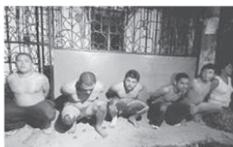
“Sospechosos. Los sujetos fueron mostrados a los medios”. EDH 10/11/05