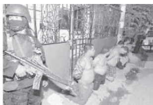
“Supuestos pandilleros son custodiados después de haber sido arrestados”. LPG 10/11/05