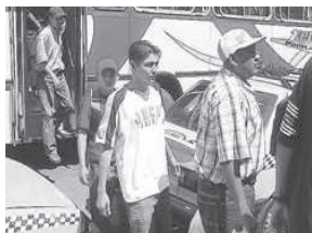
“Presuntos pandilleros llegan de San Miguel”. EDH 10/11/05.