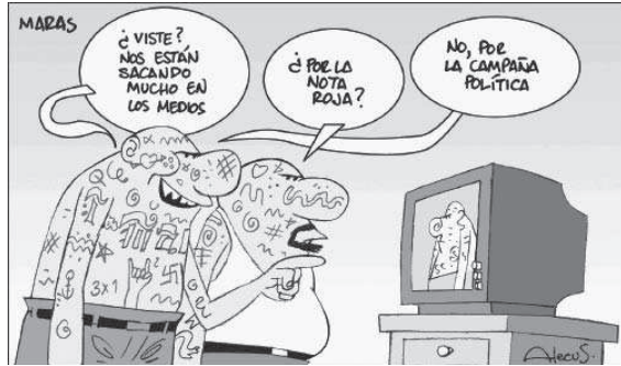
Caricatura tomada de La Prensa Gráfica. 26/02/06

¿Qué mejor receta para el éxito político que difundir y exacerbar la sensación de inseguridad y el miedo a las pandillas? Los medios de comunicación reproducen este discurso que resulta útil a los políticos. Se proporciona el fantasma adecuado con el fin de que la población elija dirigentes que concentrarán el poder para combatir el crimen “como se merece”. Al establecer este tipo de asociaciones, el discurso político electoral propaga el miedo y polariza la población. Para este estudio, es posible que si las noticias de El Salvador y Honduras fueron más en número y con un discurso que disparaba más el miedo, esto tenga que ver no sólo con una violencia real mayor en número en dichos países, sino también con el hecho de que ambos países se encontraban en un momento pre-electoral al realizar esta muestra.