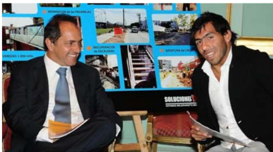
"Scioli con Carlos Tévez por obras y solidaridad" (30 de mayo de 2011) 57