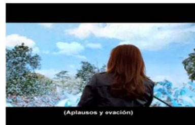
Fotograma del aviso de campaña del Frente para la Victoria.