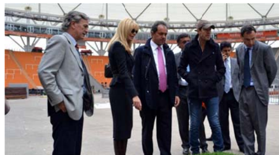
"Scioli y Tinelli en el estadio" (12 de octubre de 2011) 58

La inauguración misma del Estadio único de La Plata fue una noticia de gran repercusión, como consigna el mismo departamento de prensa: