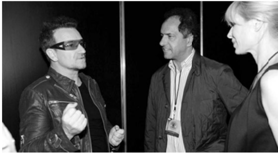
"Bono se reunió con Scioli previo al show" (1 de abril de 2011) 55

Gacetillas de prensa del Estadio único de La Plata ( http://www.estadiolp.gba.gov.ar/ )